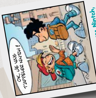
Rencontre avec Nintch, son meilleur pote