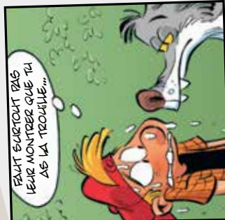
Premier animal de compagnie